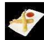
130. Ebi Fry Krokante garnalen