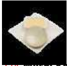
224. Mushu Kashi Pan Zoet broodje gestoomd