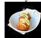
132. Iako Yaki Octopus balletjes

Di-Wo-Do 16:00 - 22:00 € 39,95 Vr-Za 16:00 - 23:00 € 42,95 Zo&Feest* 16:00 - 22:30 € 42,95** Kinderen t/m 5 jaar: per levensjaar € 3,50 Kinderen 6 t/m 10 jaar € 19,75 * Zie website voor de datums ** Met Kerst andere prijzen Voor vragen: support@shinzo.nl